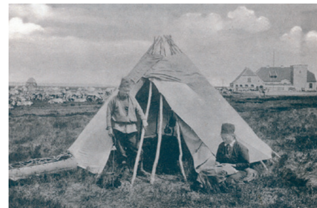
Den gamle renpark

Kongenshus Mindepark www.viborg.dk/natur-og-miljoe www.kongenshus.dk Grafisk bearbejdelse af Gyldendal