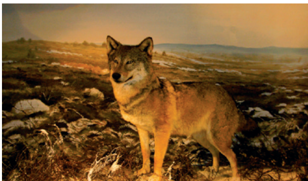
Et kikk ind i udstillingen i Naturcentret

2. Kongenshus Naturcenter: I 2005 er der åbnet en ny udstilling, hvor du kan fordybe dig i hedens og Mindeparkens natur og historie. Her kan du blandt andet se mere om de sidste urfugle i Danmark samt se film og billeder om livet på heden.